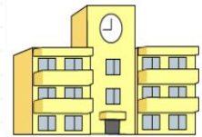
島根総合福祉専門学校